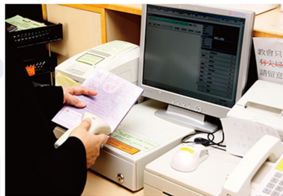
• 沙浸現時使用POS、CRM及會計一體化系統處理教會日常運作，比從前方便準確。